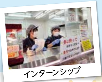
インターンシップ