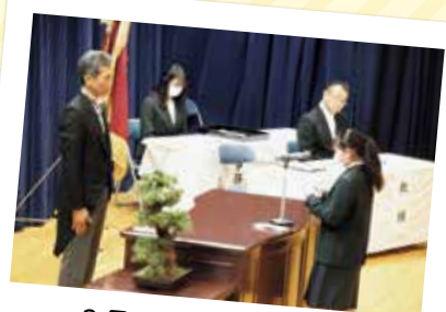
3月：卒業証書授与式