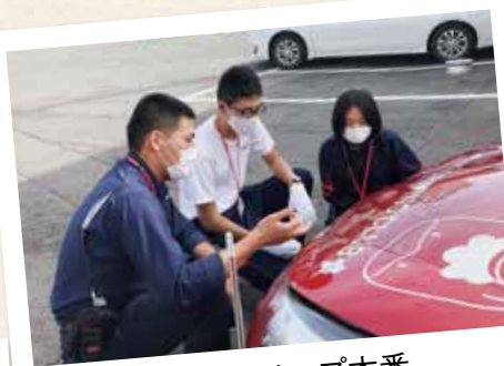
インターンシップ本番