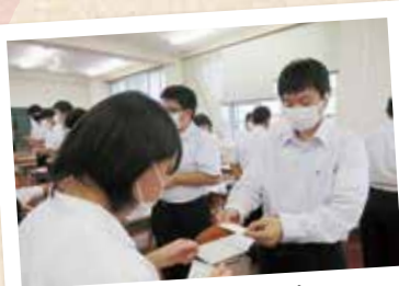
ビジネスマナー講座