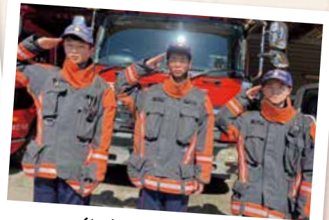
インターンシップ本番