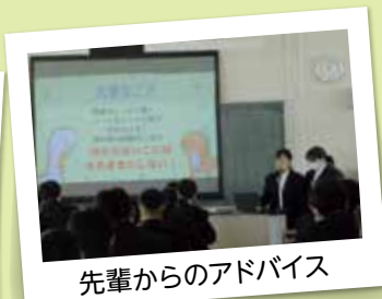
先輩からのアドバイス