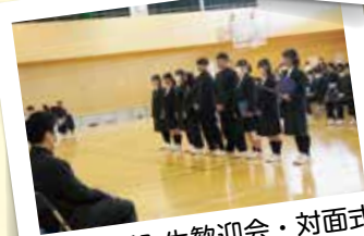
4月：新入生歓迎会・対面式