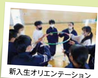
新入生オリエンテーション