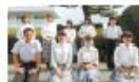
JRC部 (生徒会本部役員)