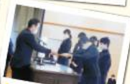
12月：生徒会役員就任式