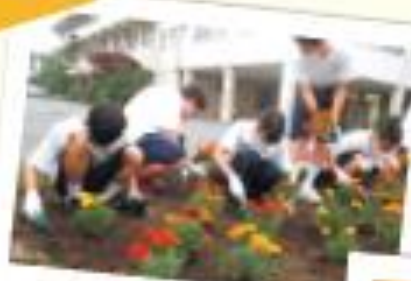
5月：花いっぱい運動