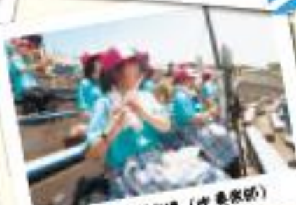
7月：野球応援（岐阜県営）