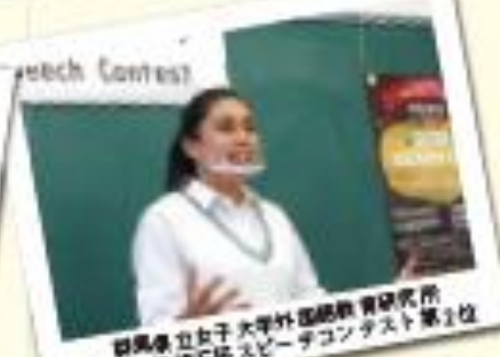
群馬県立女子大平外語国際教育研究所 2020年度第5回スピーチコンテスト第1位