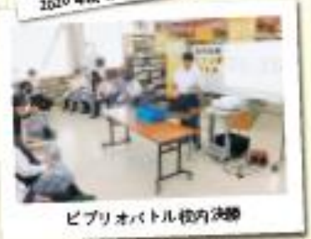
ビブリオバトル校内決勝