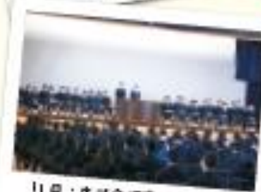
11月：生徒会選挙立会演説会