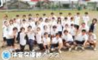
⑩ 体育祭優勝クラス