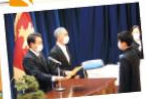
3月：卒業証書授与式