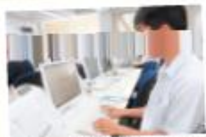
全国ビジネス文書実務検定試験1級合格(2名)