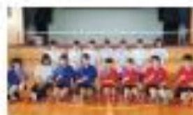
女子バドミントン部