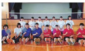
女子バドミントン部