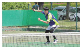
男子ソフトテニス部