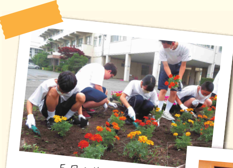
5月：花いっぱい運動