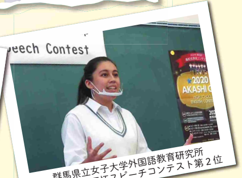
群馬県立女子大学外国語教育研究所 2020年度明石杯スピーチコンテスト第2位