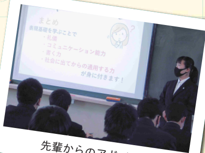
先輩からのアドバイス