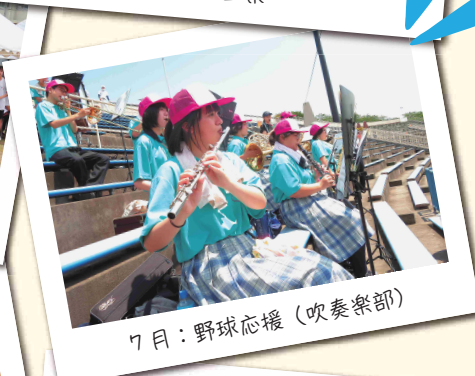
7月：野球応援（吹奏楽部）