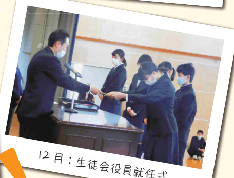
12月：生徒会役員就任式