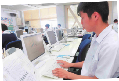
全商ビジネス文書実務検定試験1級合格(2名)