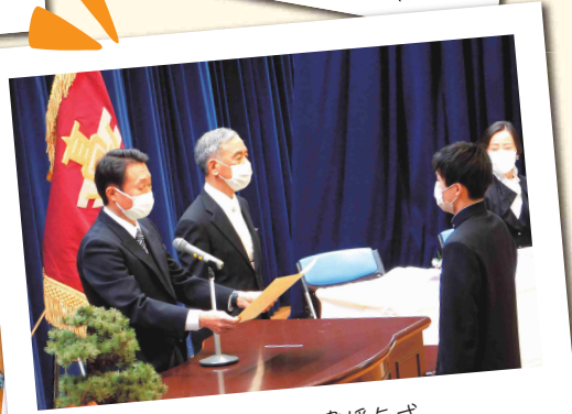
3月：卒業証書授与式