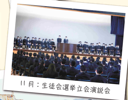
11月：生徒会選挙立会演説会