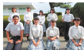
JRC部 (生徒会本部役員)