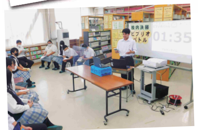
ビブリオバトル校内決勝